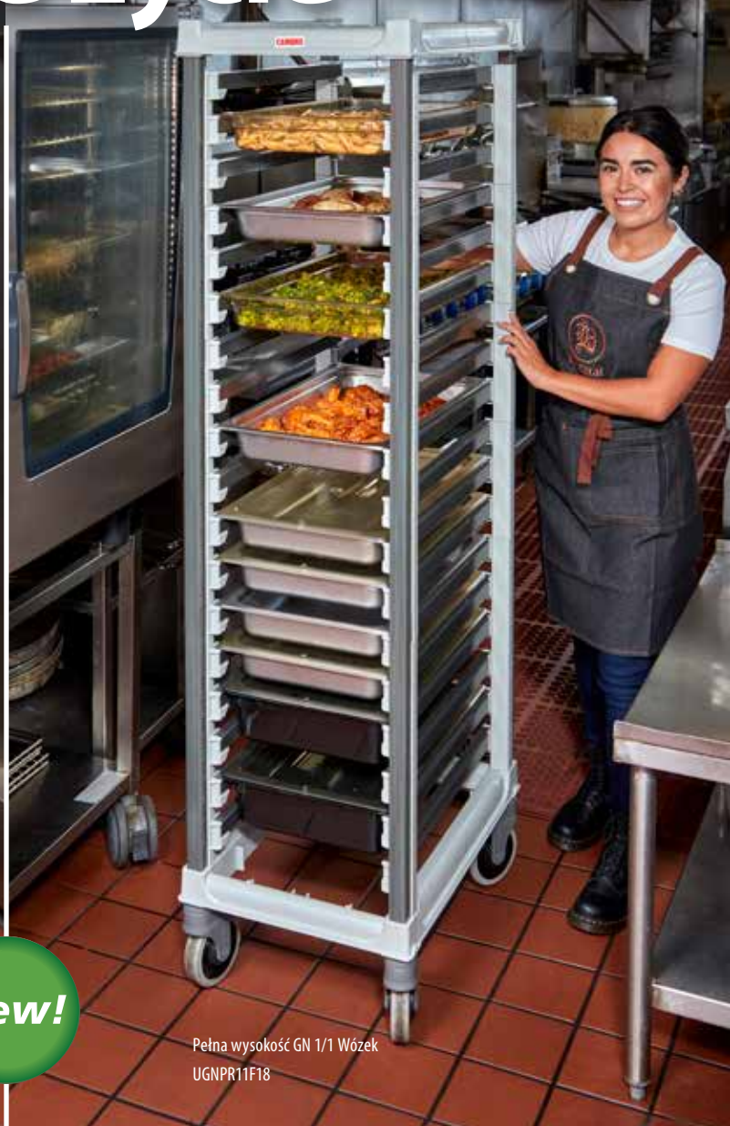
Pełna wysokość GN 1/1 Wózek UGNPR11F18