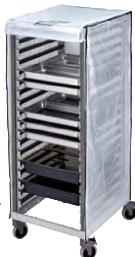
GBCTUGNPR21 Opcjonalna pokrowiec winylowy o dużej wytrzymałości do pełnego wózka GN 2/1.