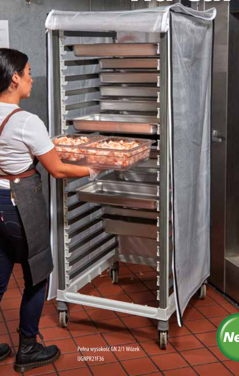
Pełna wysokość GN 2/1 Wózek UGNPR21F36